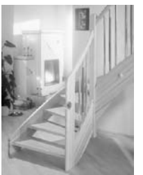
Parkett und Stiegen

Schreinerei Knipp In der Schweiz 3-9 53804 Much Tel. 02245 / 2515 Fax 02245 / 8008