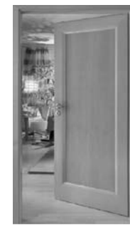
Original HGM Türen